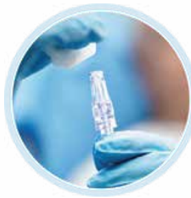
MicroClave każdy pacjent

Zawory z neutralnym ciśnieniem o innowacyjnej konstrukcji