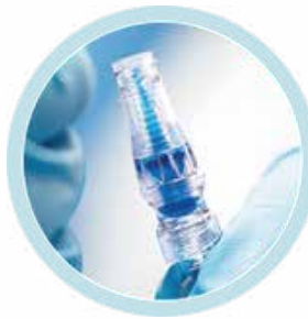
Neutron każdy pacjent