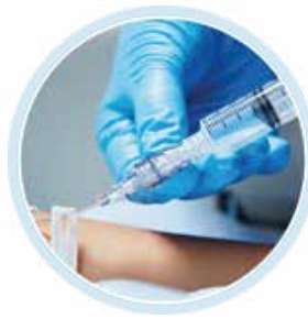
NanoClave pediatria, neonatologia