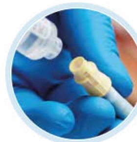
TEGO stacje dializ

Czy wiesz, że mimo tego, że zawory są do siebie podobne, niektóre z nich mogą transferować nawet o