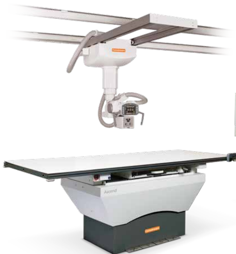
System DRX-Ascend z lampą montowaną do sufitu

Dobra wiadomość jest taka, że niezależnie od wyniku, istnieje konfiguracja produktów Ascend idealnie dopasowaną do potrzeb.