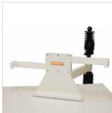
Boczny uchwyt na przetwornik/kasety