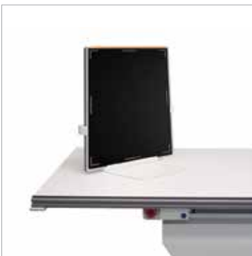
Stołowy uchwyt na przetwornik/kasety