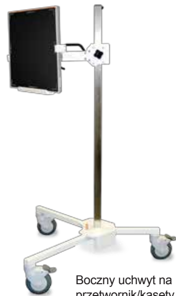
Boczny uchwyt na przetwornik/kasety, na kółkach